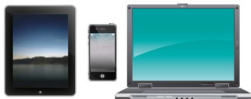
Сканирование непосредственно на ПК / мобильные устройства