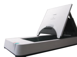
Блок планшетного сканирования 101 формата A4