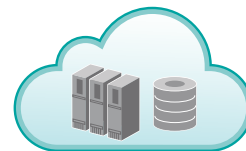
Доступ к облачным приложениям / документообороту